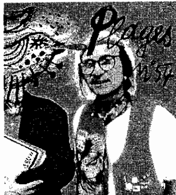
Cubierta de la revista francesa Plages

Sesenta expositores españoles y distintas galerías de países extranjeros, griegas, italianas, holandesas, francesas, etc. se dan cita en Granada para mostrar la obra de más de 400 artistas en el recinto de Ifagra.