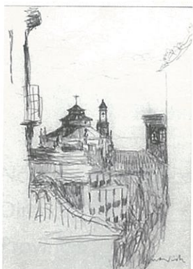
Juan Vida. Sin título. 31 x 22 cm. Lápiz sobre papel