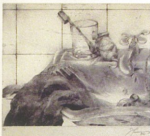
Eulalia Jiménez Molina. Sin título. 30 x 25 cm. Agua fuerte y resinas