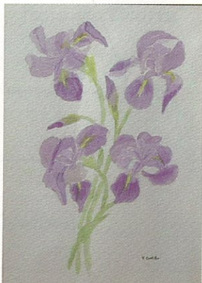
Purificación Villafranca Castillo. Lirios. 28 x 20 cm. Acuarela sobre papel