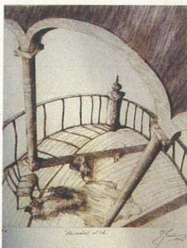
Eulalia Jiménez Molina. Animales al sol. 30 X 25 cm. Aguafuerte