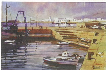
Julio Visconti Merino. Marina. 49 x 33 cm. Acuarela sobre papel